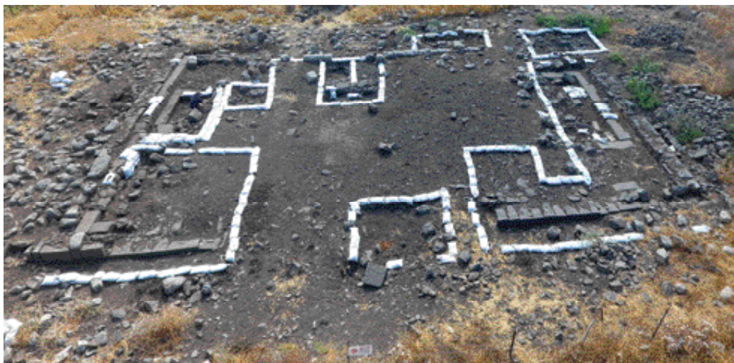
בית הכנסת במגדוליה, מבט לכיוון מזרח

עד כה נחפר כמעט עד תום רק מאוזוליאום שמצוי כ־20 מטרים ממזרח לדרך ולמגדלי הקבורה. הוא בנוי באבני בזלת מסותתות. הקומה הראשונה, שהכילה את הקברים, מקורה בקימרון שנשא את הקומה השנייה. אם לשפוט על פי פריטי האבן המעוצבים בקפידה ושרידי הכרכוב של הקומה העליונה, במקור אולי היה המבנה בעל שלוש קומות. שרידים מפוסלים של שני אריות וחלקים מאיצטרובל, עשויים באבן גיר, נתגלו במבנה. ייתכן שהם שימשו לעיטור גגו של מבנה הקבורה המונומנטלי. המבנה הוקם במאה השנייה לספירה ותיפקד בעיקר עד למאה הרביעית. ייתכן שהוא קרס ברעש האדמה של שנת 363 לספירה, שפגע במספר מכלולי בנייה בסוסיתא. מבני הקבורה המפוארים ניכרו היטב באזור, וכל מי שנע בציר זה לכיוון הגולן או מערבה לעבר הכינרת יכול היה להתרשם מן ההדר הרב שלהם. מעניין שבכל המרחב הכפרי בגולן, למרות הסקרים הרבים שנערכו בו, זוהו עד היום רק מעט בתי קברות שתוארכו לתקופה הרומית. במגדוליה לא התגלה בית קברות, דבר שיכול להעיד על קבורה פשוטה בשוחות.