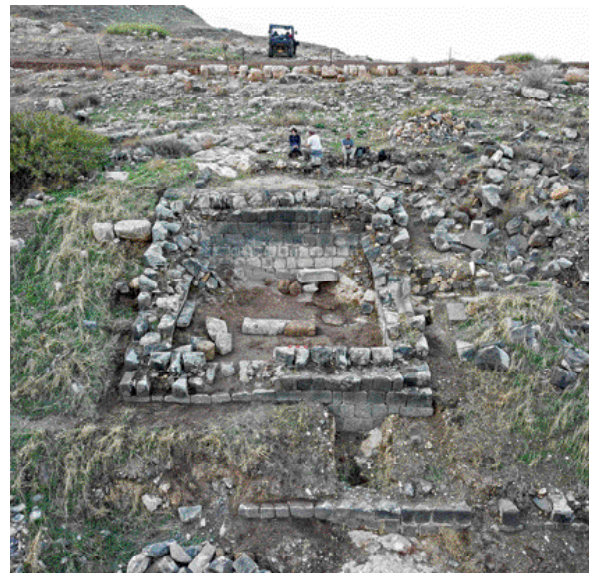
המחוזיאום באוכף של סוסיטא, מבט למערב

בשנים האחרונות נחפר מתחם מהתקופה הרומית, שצמוד לחפיר ומצפון מערב לו לכיוון רמת ההר. המתחם נבנה מחוץ לחומות העיר, כך שכל מי שהעפיל לסוסיטא ממזרח הכינרת יכול היה לראותו בנקל. עד כה נחשפו במתחם זוהו בו, שער מבוא מפואר (פרופילאום), בית מרחץ ציבורי ותיאטרון. הנכנס בשערי המבוא צעד כ־30 מטר והגיע לבית מרחץ ציבורי מפואר שנחשף בחלקו. לא רחוק משם זוהה תיאטרון שהכיל עד כ־3,500 צופים. המתחם