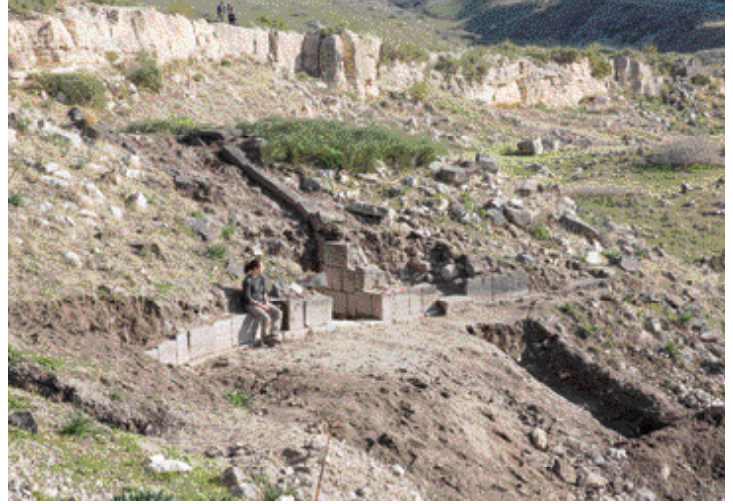
התיאטרון בסוסיטא

אחת מן הדרכים לאפיין את מקור אבני הבנייה, ודאי בבנייה ציבורית, הוא איתור המחצבות וניסיון להתחקות אחר מקור אבני הגזית. המחצבה בגולן טרם אותרה לפי שעה, אך הבזלות בגולן הן בשנים אלו במרכזו של מחקר שמטרתו לאפיין את אזורי הבזלת באמצעות בדיקה כימית וליצור מסד נתונים שיאפשר זיהוי של פריטים אדריכליים ומקורם בגולן.