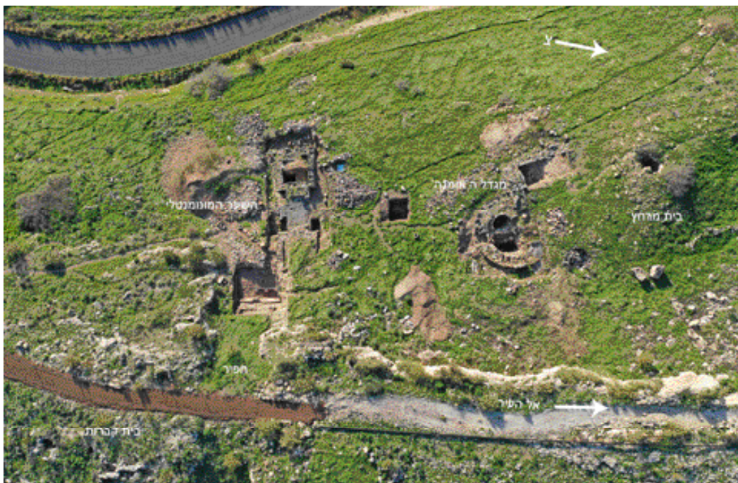
מבט על החפירות במרכז האוכף של סוסיטא