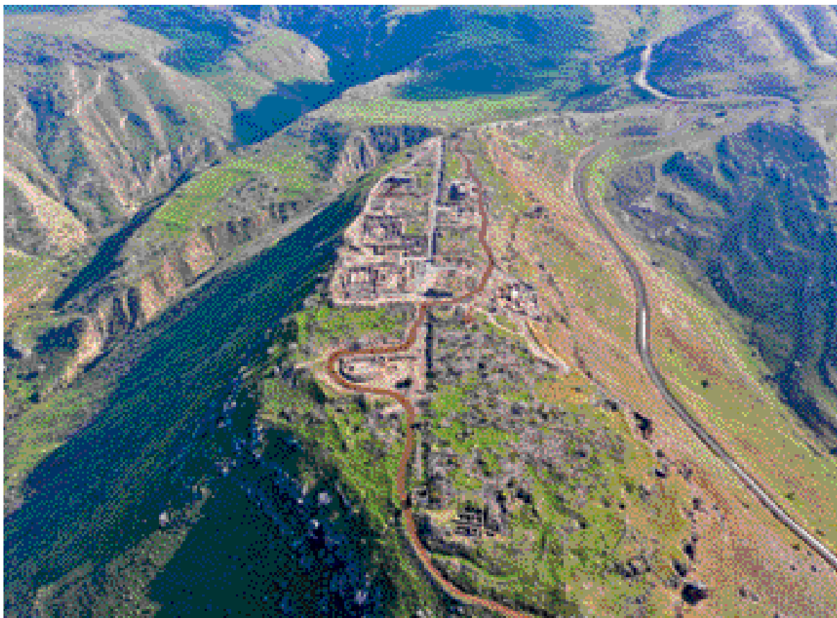
הר סוסיתא. מבט לכיוון מזרח