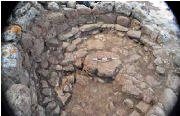
כבשן ליצור כלי חרס, מג'דוליה

וכעיר הנוצרית הראשית באזור הכינרת והגולן. העיר חרבה מבלי שתיושב בשנית בעקבות רעש האדמה בשנת 749 לספירה. העדויות הארכאולוגיות מצביעות על כך שסוסיא של שלהי המאה השביעית ותחילת המאה השמינית לספירה כבר איננה עיר אלא עיירה דועכת.