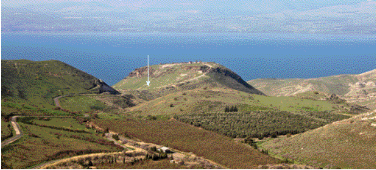
האוכף של הר סוסיא וסביבתו, מבט לכיוון מערב